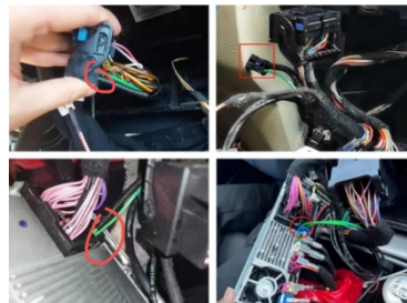
8. Entfernen Sie das Glasfaserkabel, stecken Sie das neue Kabel ein und schließen Sie das Radio an.