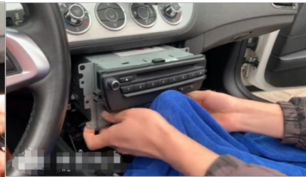
5. Entfernen Sie die Haupteinheit des Radios