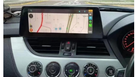
9. Effektbild nach Abschluss der Installation