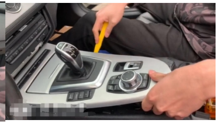
3. Demontage eines Autogetriebes