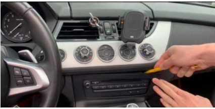
1. Entfernen der äußeren Verkleidungsleiste des Radios