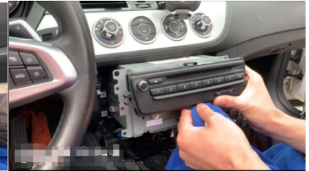
6. Achten Sie darauf, den